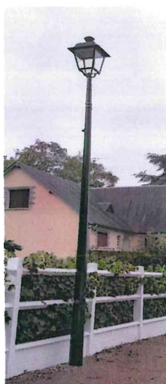
Mat OCTOGONAL 6 mètres avec lanterne MONTMARTRE