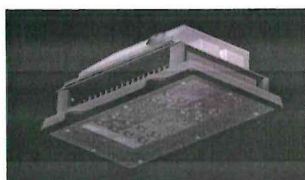
Kit LED adapté à la lanterne

Les photos ci-dessous présentent le matériel prévu pour ce projet :